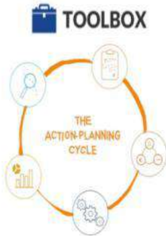
ACTION PLANNING STAGES